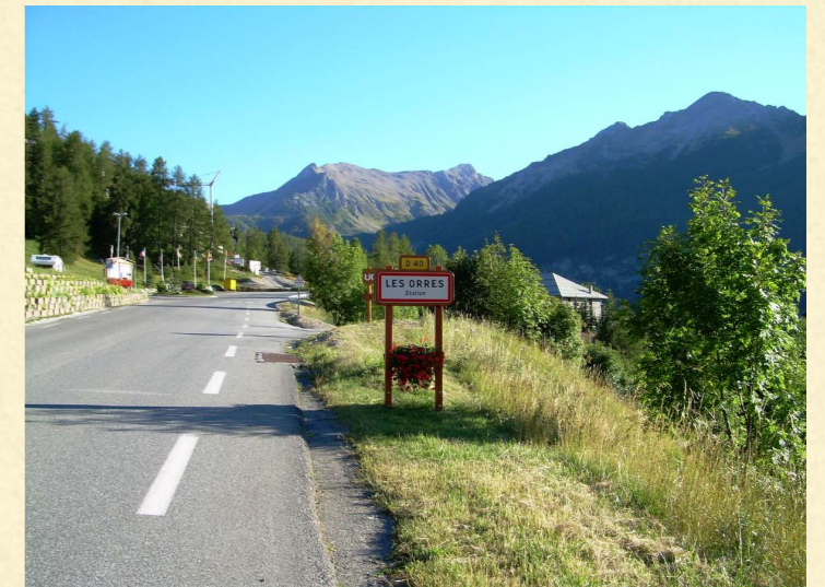
Montée des Orres