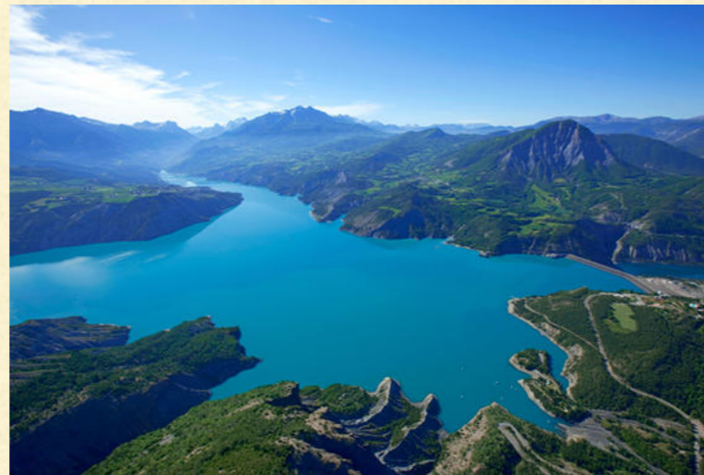
Faire le tour du lac de Serre-Ponçon à bicyclette