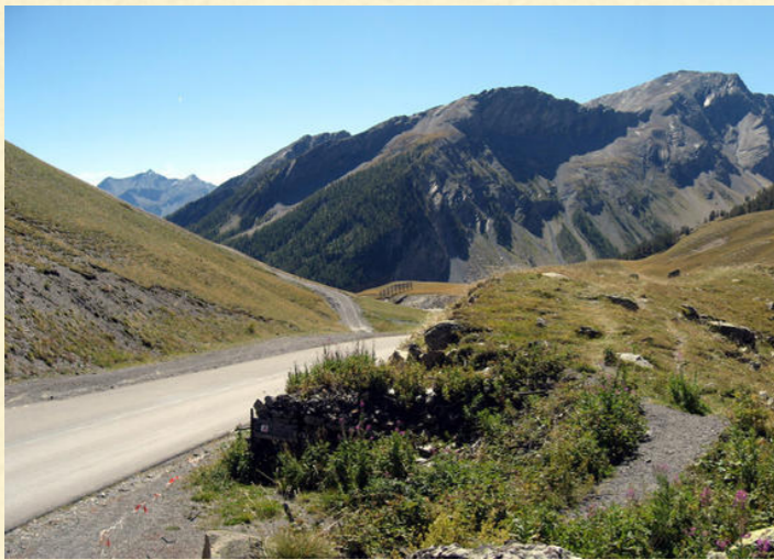
Col de l'Izoard