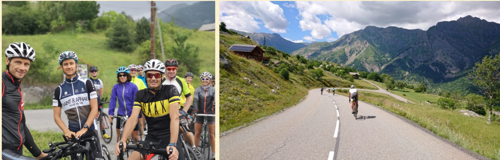
Les routes de l'Embrunman

Chacun à votre rythme, vous allez découvrir des paysages à couper le souffle. Roulez sur le parcours mythique de l'Embrunman! Ça vous donnera peut être des idées pour le futur ;-)