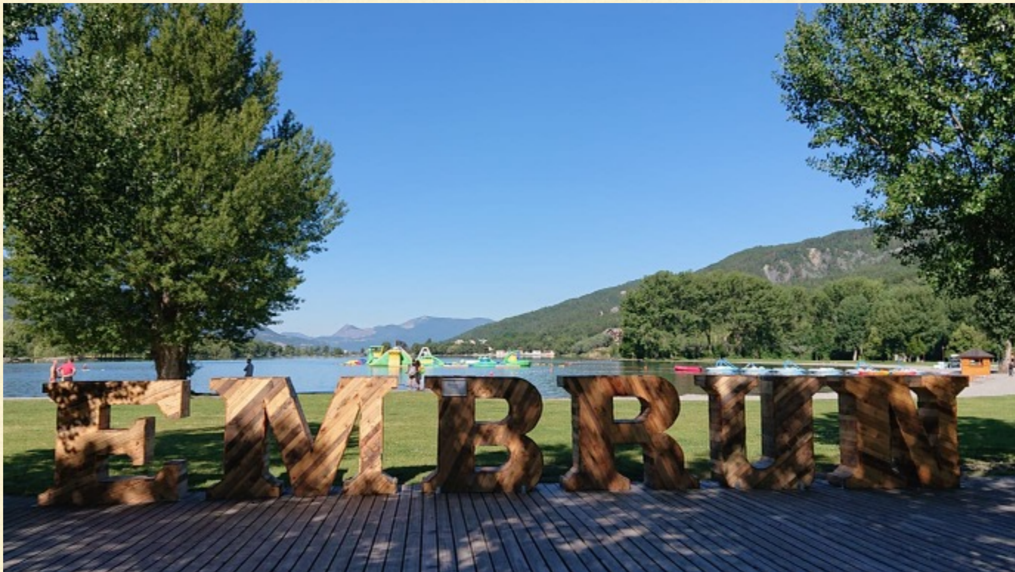
Plan d'eau d'Embrun