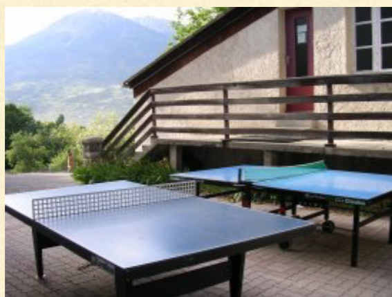
Le centre de vacances se situe à Baratier à 2km d'Embrun, entouré d'un grand parc boisé de 4Ha.

Vous n'aurez qu'à vous concentrer sur le programme, et vous laissez coacher, vous serez les lers surpris de voir en fin de semaine comme les 20h d'entraînements sont bien passées !